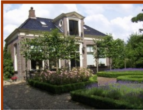
Renteniers woning Efterwei 32, Rottevalle